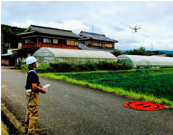
ドローンを活用したリモートセンシング

収穫した酒米で造った日本酒は、循環型社会の実現と企業連携の産物という意味を込めて「環和」と名付けました。株式会社神戸酒心館は神戸市北区大沢(おおぞう)地区と村米(むらまい)制度と呼ばれる酒米取引制度により良質の「山田錦」を確保してきましたが、これからはこのような地域支援型農業(CSA)を通じて「山田錦」の質・量両面にわたる将来の姿を考察するうえで、極めて意義があることと考えています。