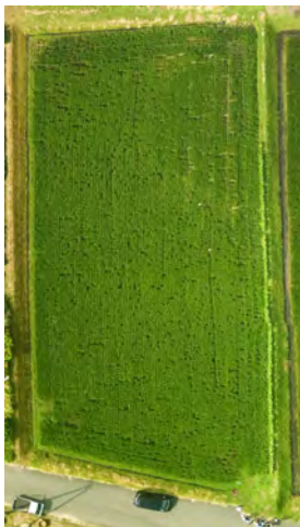
解析技術から得られるデータ